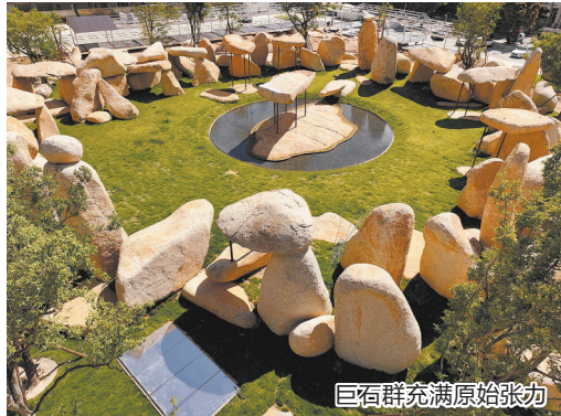
巨石群充满原始张力