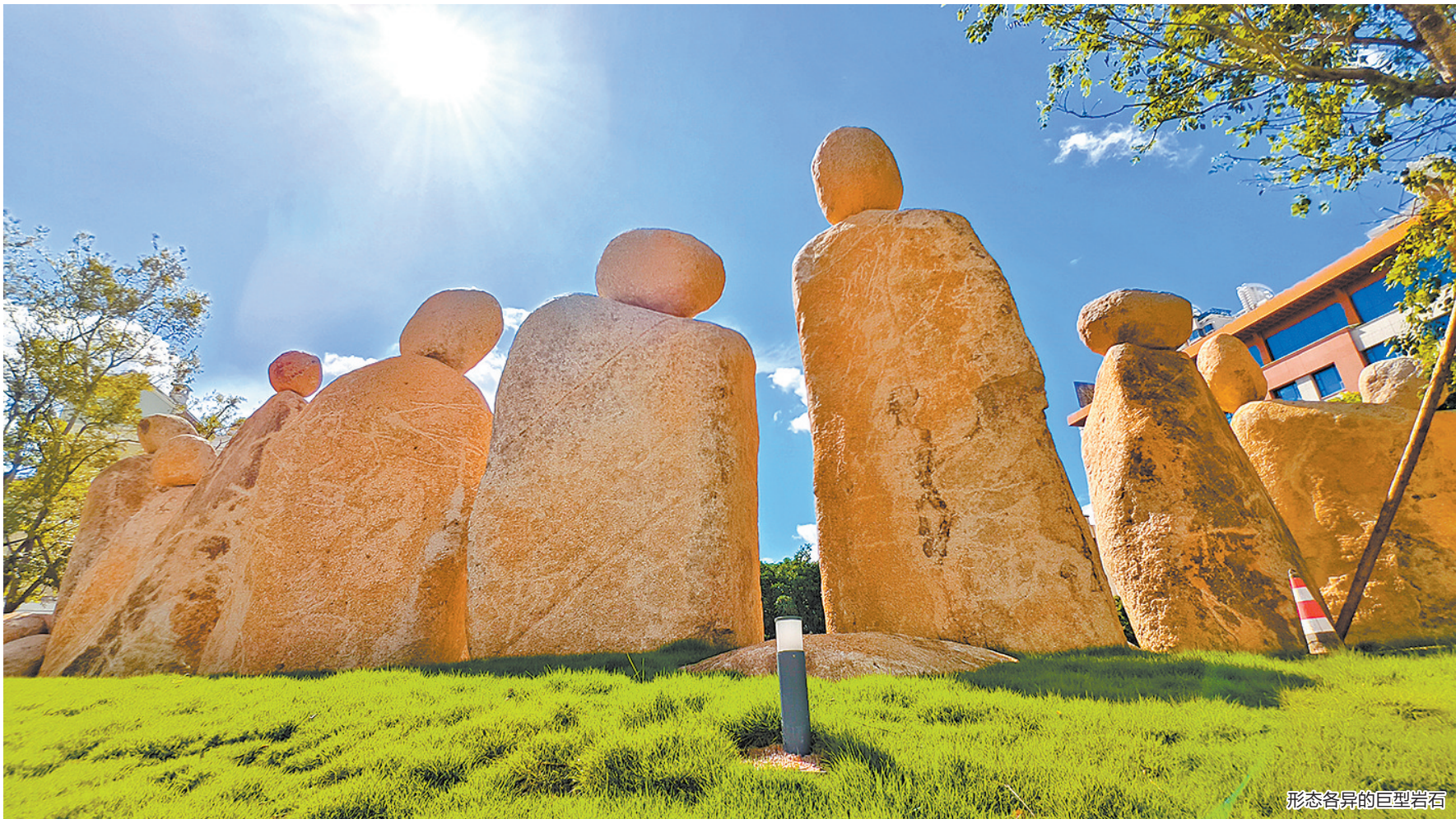
形态各异的巨型岩石