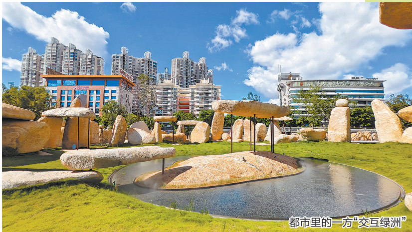
都市里的一方“交互绿洲”