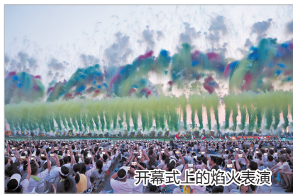
开幕式上的焰火表演