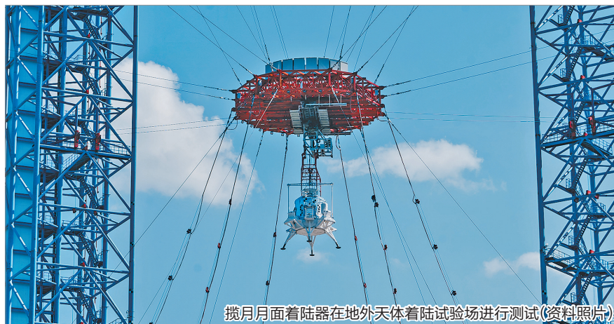
揽月月面着陆器在地外天体着陆试验场进行测试(资料照片)

据悉,三部门同时联合发布10起典型案例,反映了各地认真开展行政复议服务企业高质量发展工作取得的突出成效,为各地行政复议机构、涉企行政管理部门和工商联继续强化协同配合,共同推动高质效办理涉企行政复议案件,妥善化解涉企行政争议,依法平等保护各类经营主体合法权益,促进提升涉企行政执法水平提供了示范指引。(齐琪)