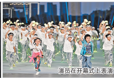
演员在开幕式上表演