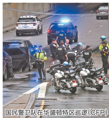
国民警卫队在华盛顿特区巡逻

据美国媒体报道,在华盛顿特区内执勤的国民警卫队规模于当地时间13日晚“大幅增加”,并将由仅夜间执勤变为“一周7天、每天24小时”不间断执勤。