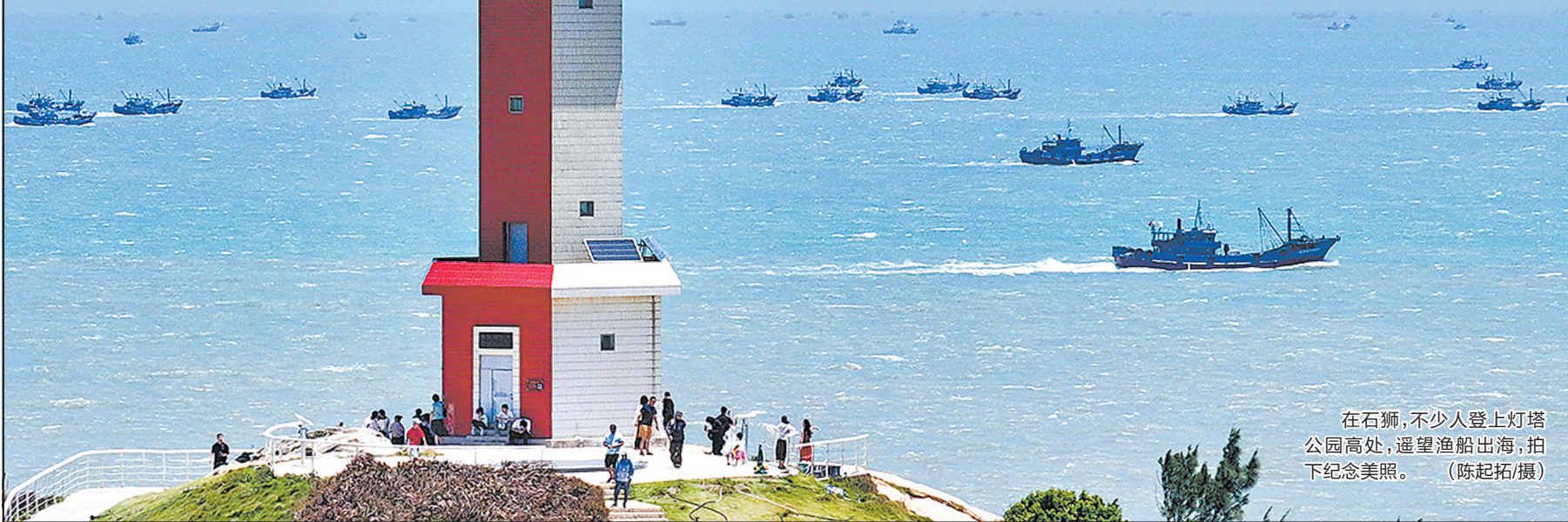
在石狮,不少人登上灯塔公园高处,遥望渔船出海,拍下纪念美照。