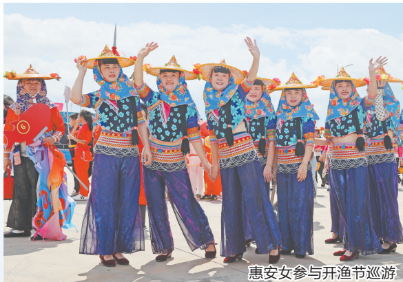
惠安女参与开渔节巡游