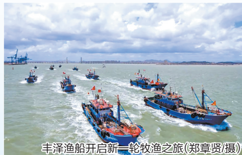
丰泽渔船开启新一轮牧渔之旅