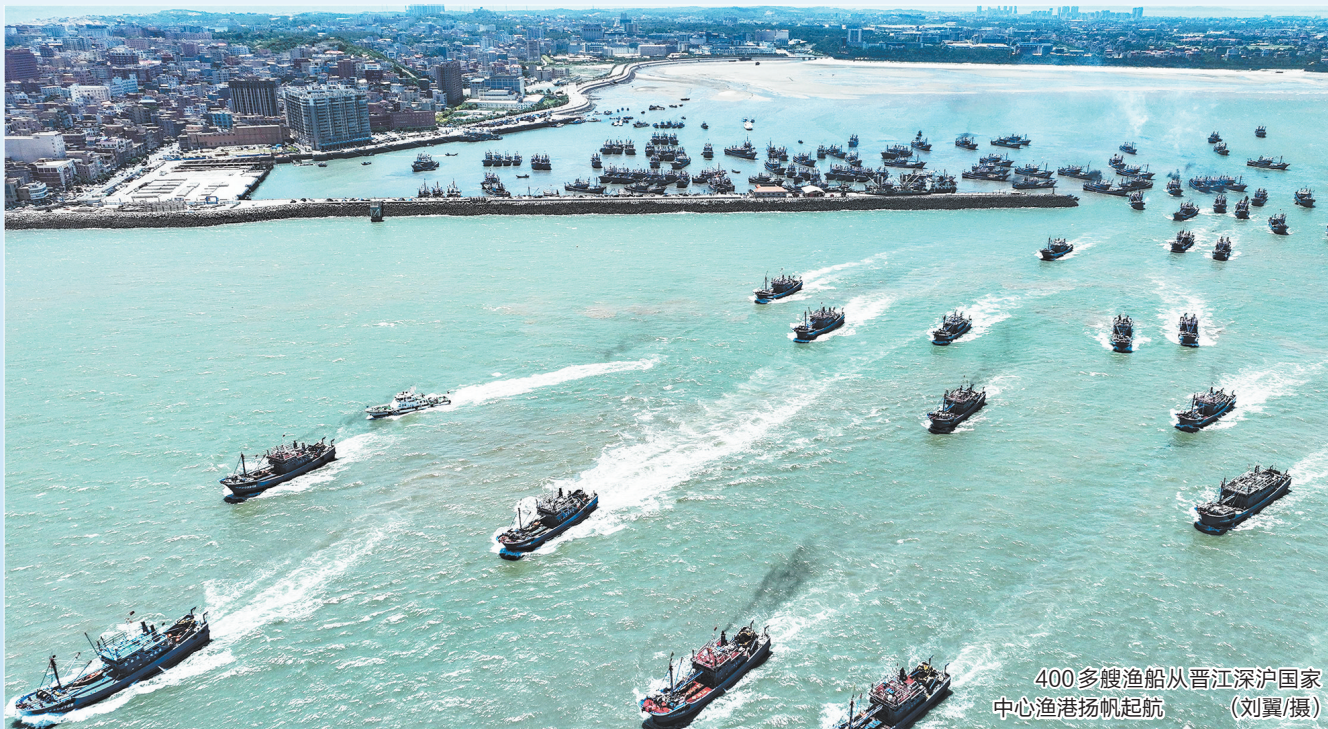
400多艘渔船从晋江深沪国家中心渔港扬帆起航

8月16日12时,随着悠长的汽笛声响彻泉州沿海,为期三个半月的伏季休渔正式结束。全市2049艘渔船从惠安、石狮、晋江、丰泽等渔港码头扬帆起航,开启新一轮耕海牧渔的丰收之旅。