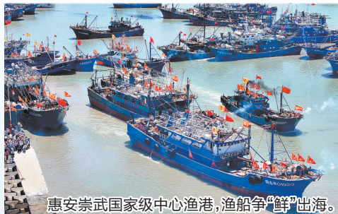
惠安崇武国家级中心渔港,渔船争“鲜”出海。