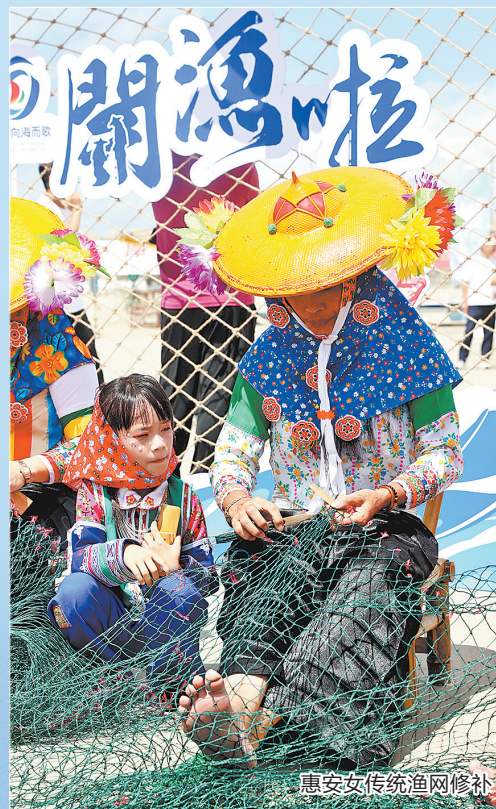
惠安女传统渔网修补