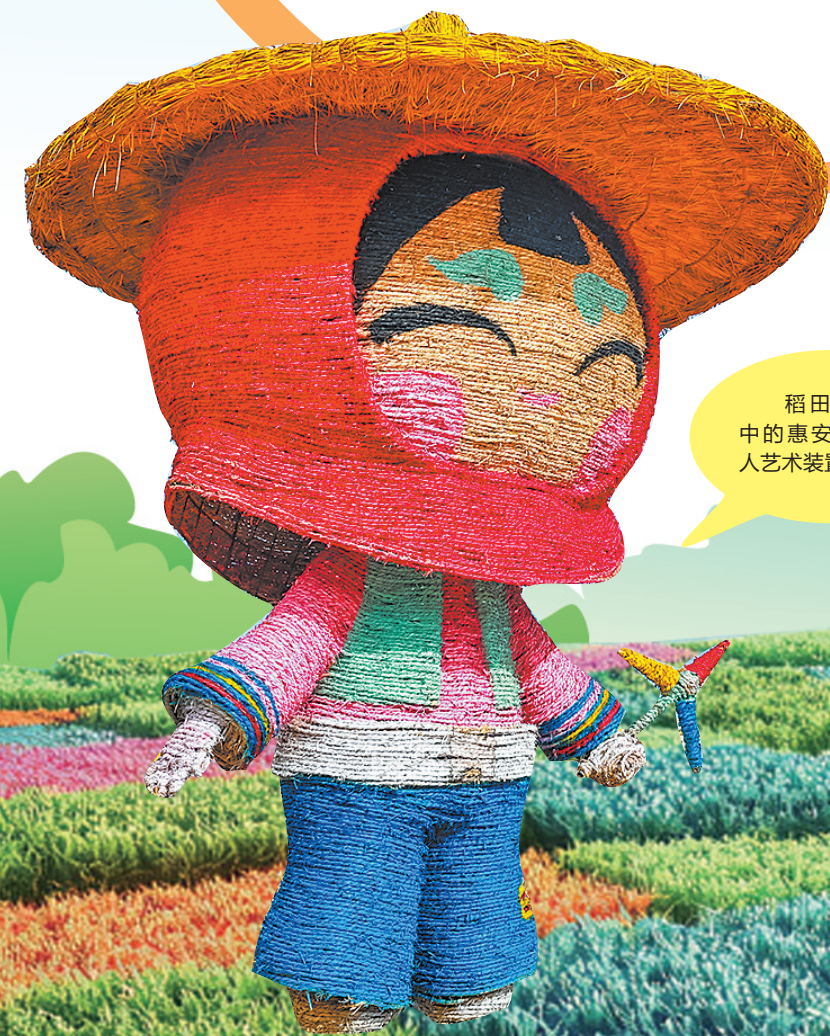
稻田艺术展中的惠安女稻草人艺术装置

当前,惠安县正以体验带动消费,深度融合在地文化、艺术IP与可持续理念,在走马埭打造起高溢价、强黏性的消费场景。并通过在地风物艺术化、消费过程仪式化、商品功能社会化,让消费成为文化传承的投票器,实现社会效益与经济效益的双赢,铺就一幅游客有看头、群众有奔头的新时代乡村文化繁荣景象。