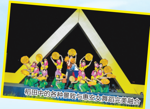
稻田中的各种景致与惠安女舞蹈完美融合