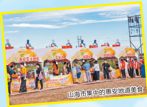
上海市集中的惠安地道美食