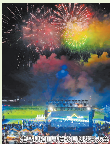
走马埭稻田开启秋日烟花秀大会

作为2025年泉州开渔文旅消费季惠安区域的重要活动之一,走马埭稻田艺术节向市民游客全方位展示了惠安的乡村美景及文化底蕴,通过丰富文旅消费场景,打造具有当地特色的农文旅融合发展新模式,将