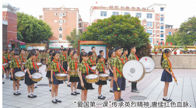
“爱国第一课”传承英烈精神,赓续红色血脉。