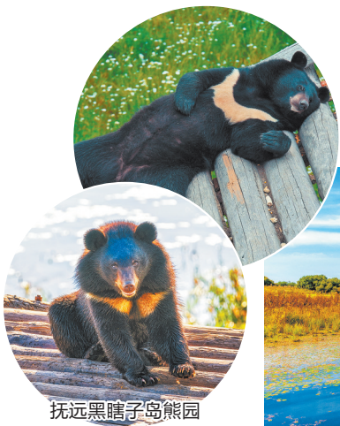
抚远黑瞎子岛熊园