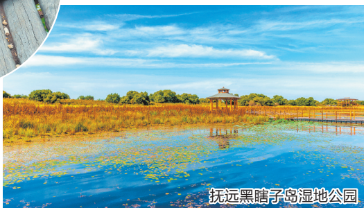
抚远黑瞎子岛湿地公园

作为我国陆地最东端,黑瞎子岛自白露起便浸于秋凉,日均最高温降至25℃以下,昼夜温差达12℃,清晨需添薄衫,凉意舒爽。这里是全国最早见日出之地,破晓时,黑龙江与乌苏里江交汇处天际线黛青染金红,朝阳跃江瞬间,波光与霞光交织,岸边草叶