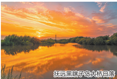
抚远黑瞎子岛大桥日落