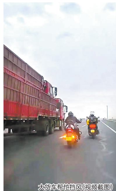
大货车帮忙挡风(视频截图)