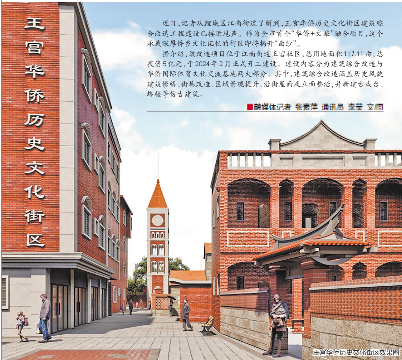
王宫华侨历史文化街区效果图