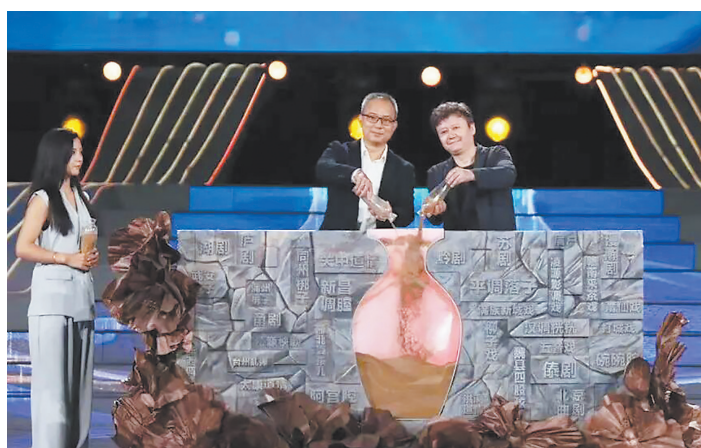
现场举行“合土纪”仪式