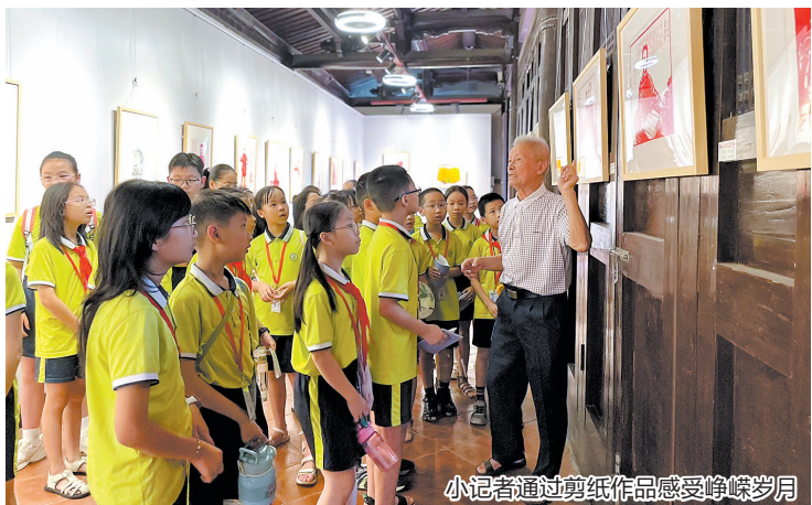
小记者通过剪纸作品感受峥嵘岁月