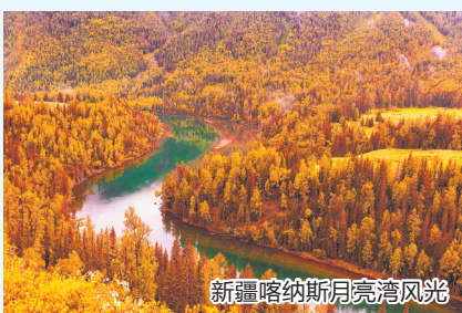
新疆喀纳斯月亮湾风光