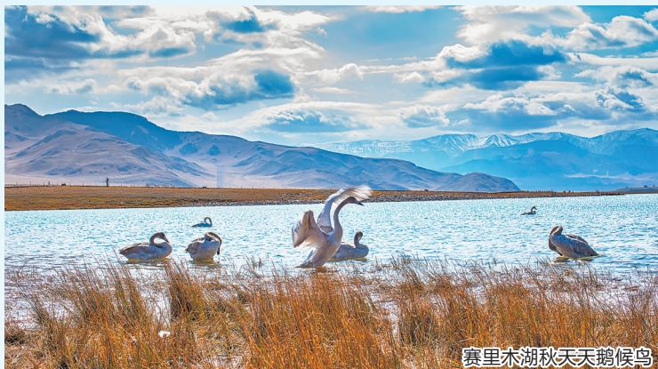
赛里木湖秋天天鹅候鸟