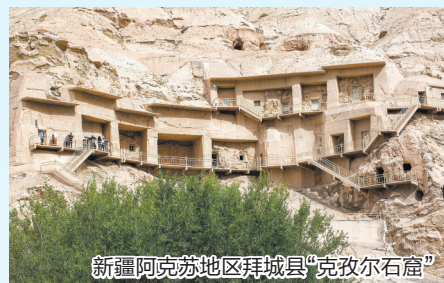
新疆阿克苏地区拜城县“克孜尔石窟”