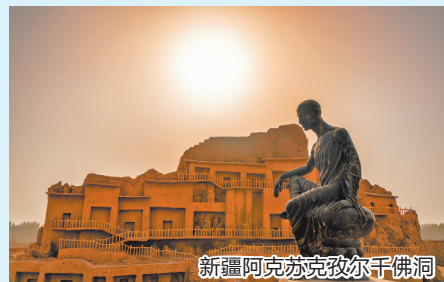
新疆阿克苏克孜尔千佛洞