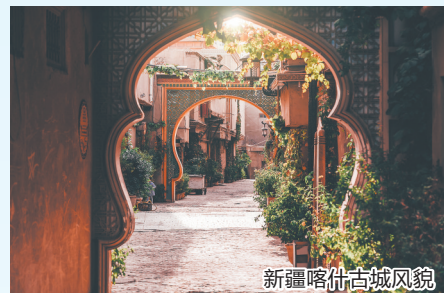
新疆喀什古城风貌