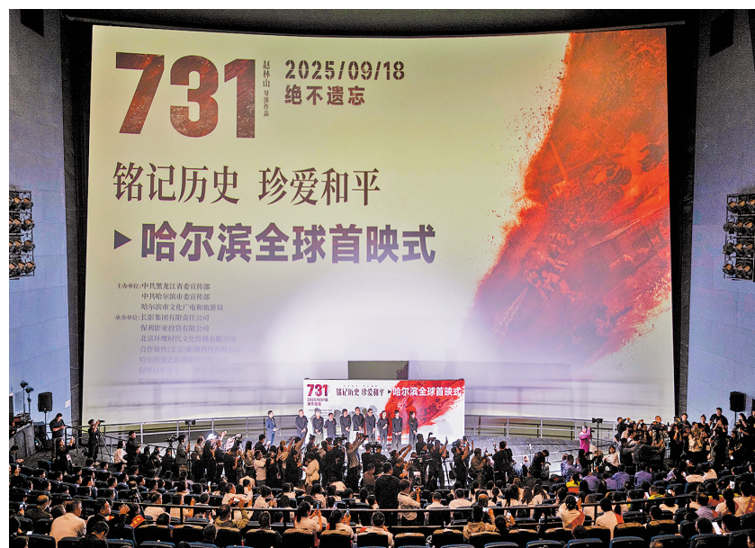
9月17日在哈尔滨市哈东万达影城拍摄的《731》全球首映仪式现场。