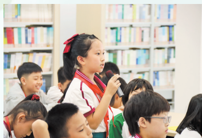
小记者诵读儿童诗,感受其中的“巧思”。