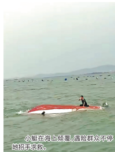
小艇在海上倾覆,遇险群众不停地招手求救。

海上危情显担当,渔民义举暖人心。泉港公安分局经过调查核实,警方于9月17日正式为救人的3位渔民颁发《见义勇为确认证书》,以表彰他们挺身而出勇救落水者的勇毅与善良。