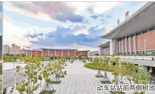
动车站站前两侧树池