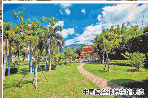
中国闽台缘博物馆周边

早报讯（融媒体记者林福龙 庄丽祥 文/图）今年以来，泉州市城管局持续推进刺桐树种植工作，种植范围覆盖景区景点、高速公路、动车站周边、进出城道路，以及古城核心区域（相关报道详见早报8月22日A03版）。截至目前，市城管局园林绿化中心已新植刺桐超2000株，预计今年10月底可完成全部3000株的种植任务。