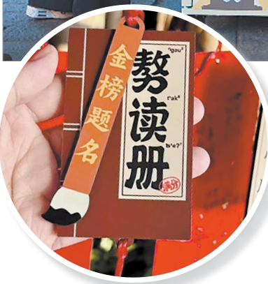
▲文创自助贩售机解锁文化体验新玩法