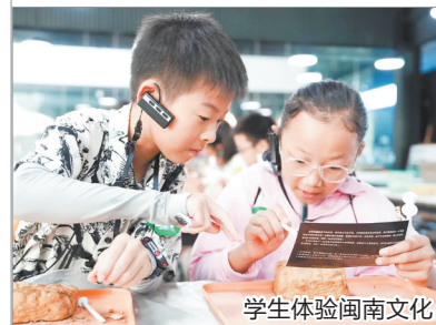
学生体验闽南文化

本报讯(融媒体记者张素萍 通讯员黄明珍 文/图)国庆中秋“双节”期间,泉州市博物馆以“红色传承+闽南文化”为核心脉络,策划举行系列主题活动。该博物馆通过创新文化传播方式与互动体验形式,将博物馆打造成一所大学校,让青少年了解闽南文化,为泉州文化的传承与发展注入活力。