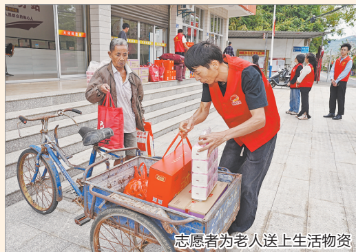
志愿者为老人送上生活物资