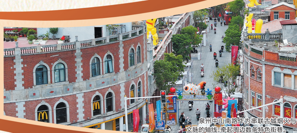
泉州中山南路作为串联古城烟火与文脉的轴线,牵起周边数条特色街巷。