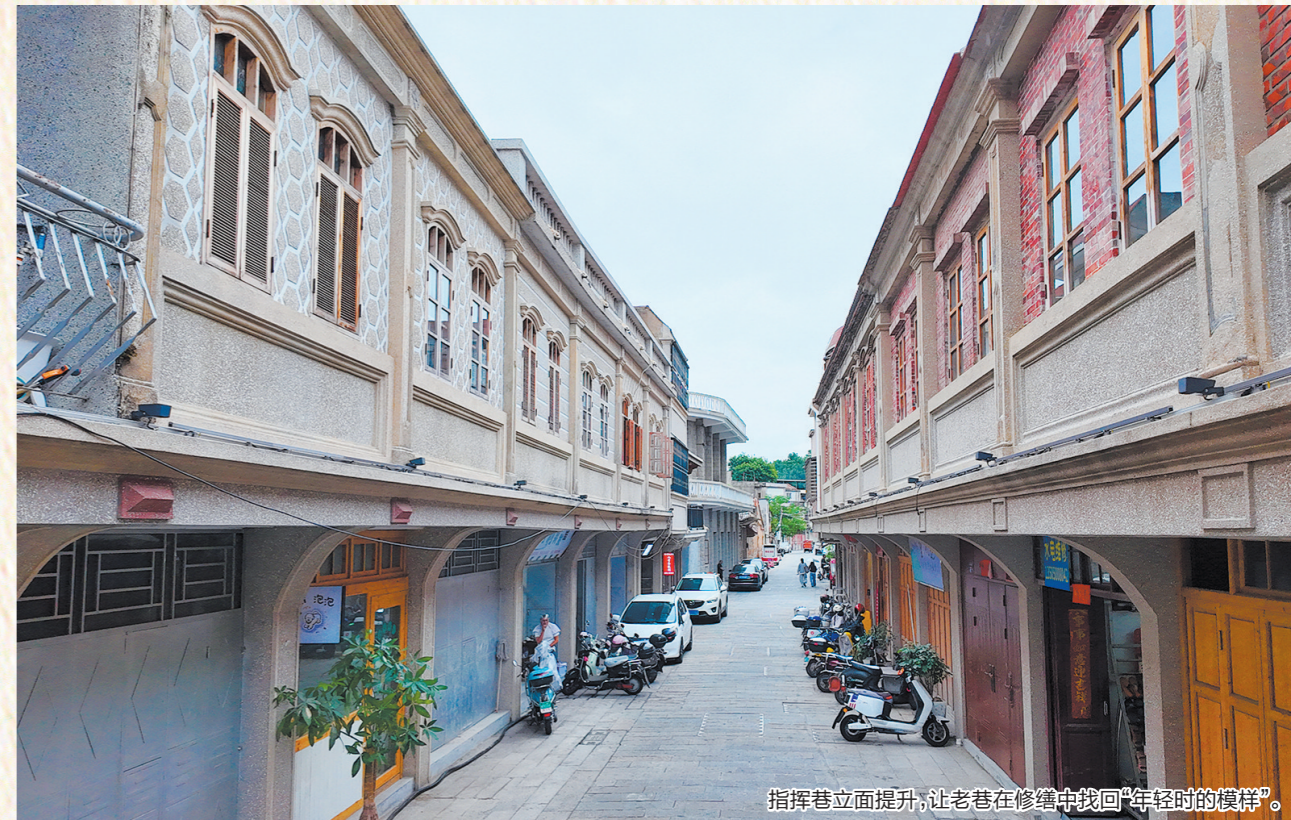
指挥巷立面提升,让老巷在修缮中找回“年轻时的模样”。