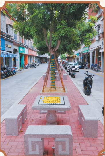
▲灵慈宫街整改后,郁郁葱葱的绿化带,成为市民休闲好去处。

这场以“修旧如旧”为核心的改造,让周边老巷在保留历史肌理的同时,成为更宜居、宜行的“生活载体”。