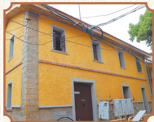
▲开闭所在外观设计上也下了不少功夫,融入街巷后风貌焕然一新。