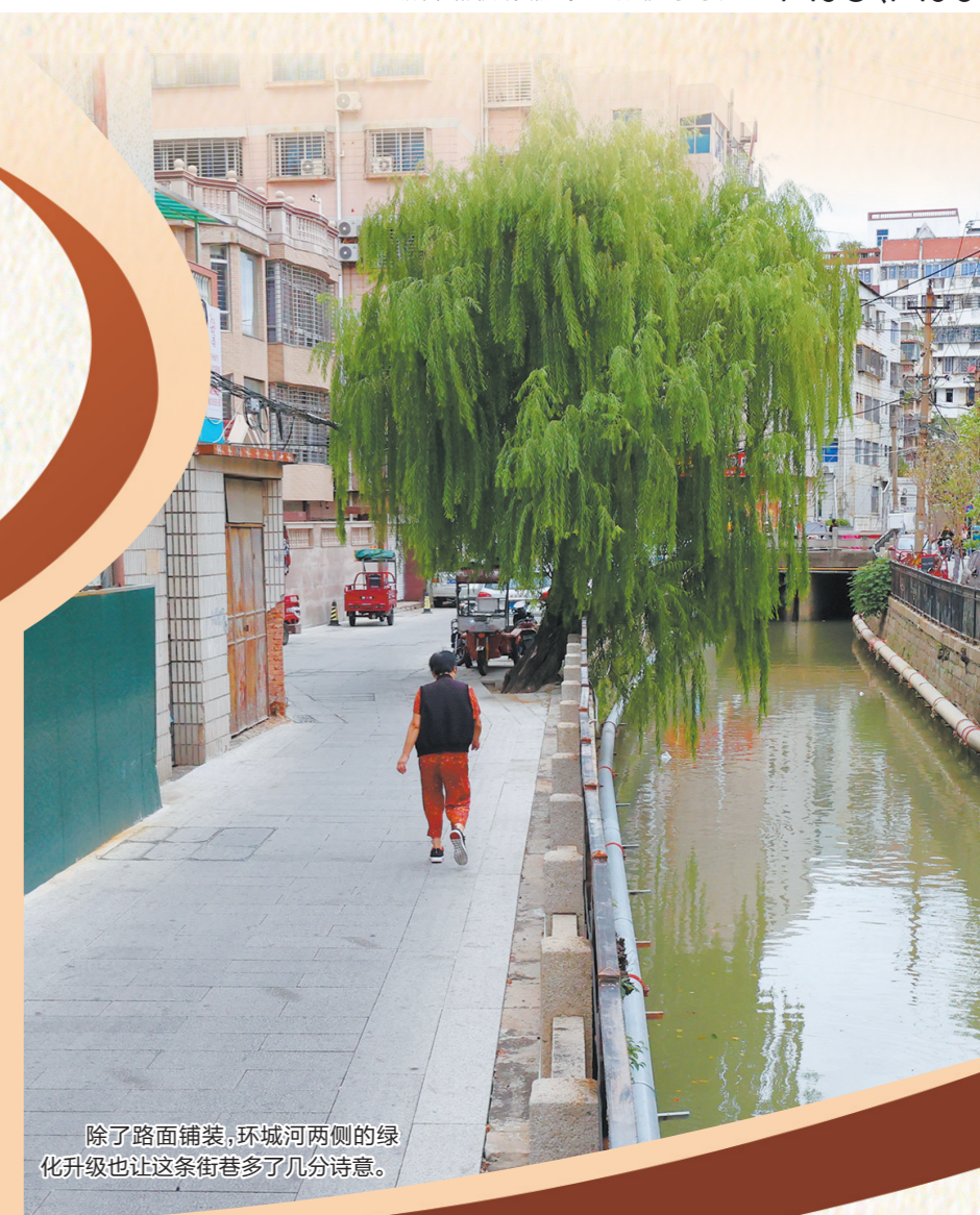
除了路面铺装,环城河两侧的绿化升级也让这条街巷多了几分诗意。