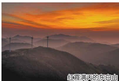
红霞满天的东白山