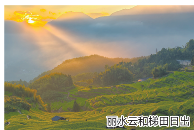
丽水云和梯田日出