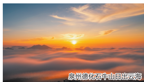
泉州德化石牛山日出云海