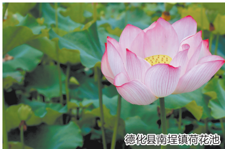
德化县南埕镇荷花池