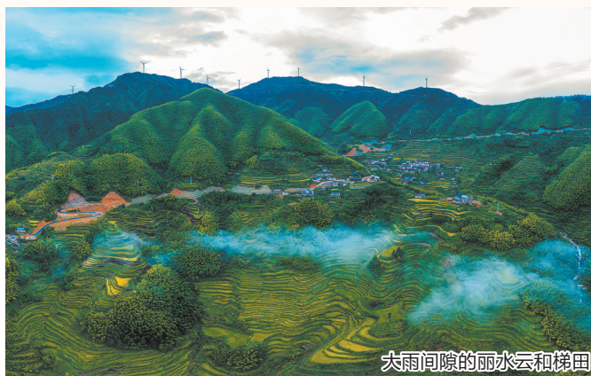
大雨间隙的丽水云和梯田