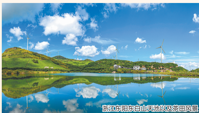
浙江东阳东白山天池以及茶田风景