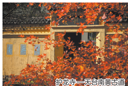
护龙寺一天台南黄古道