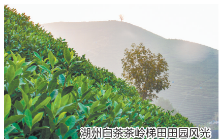
湖州白茶茶岭梯田田园风光