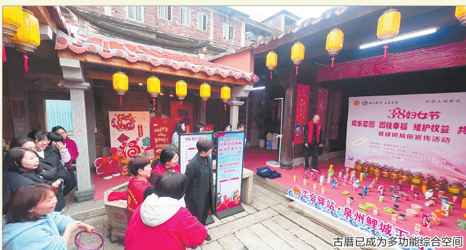
古厝已成为多功能综合空间