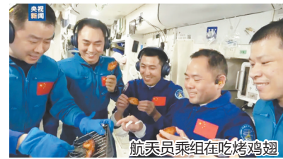
航天员乘组在吃烤鸡翅

中新社电 据中国载人航天工程办公室4日消息，神舟二十号乘组将于11月5日返回地球。