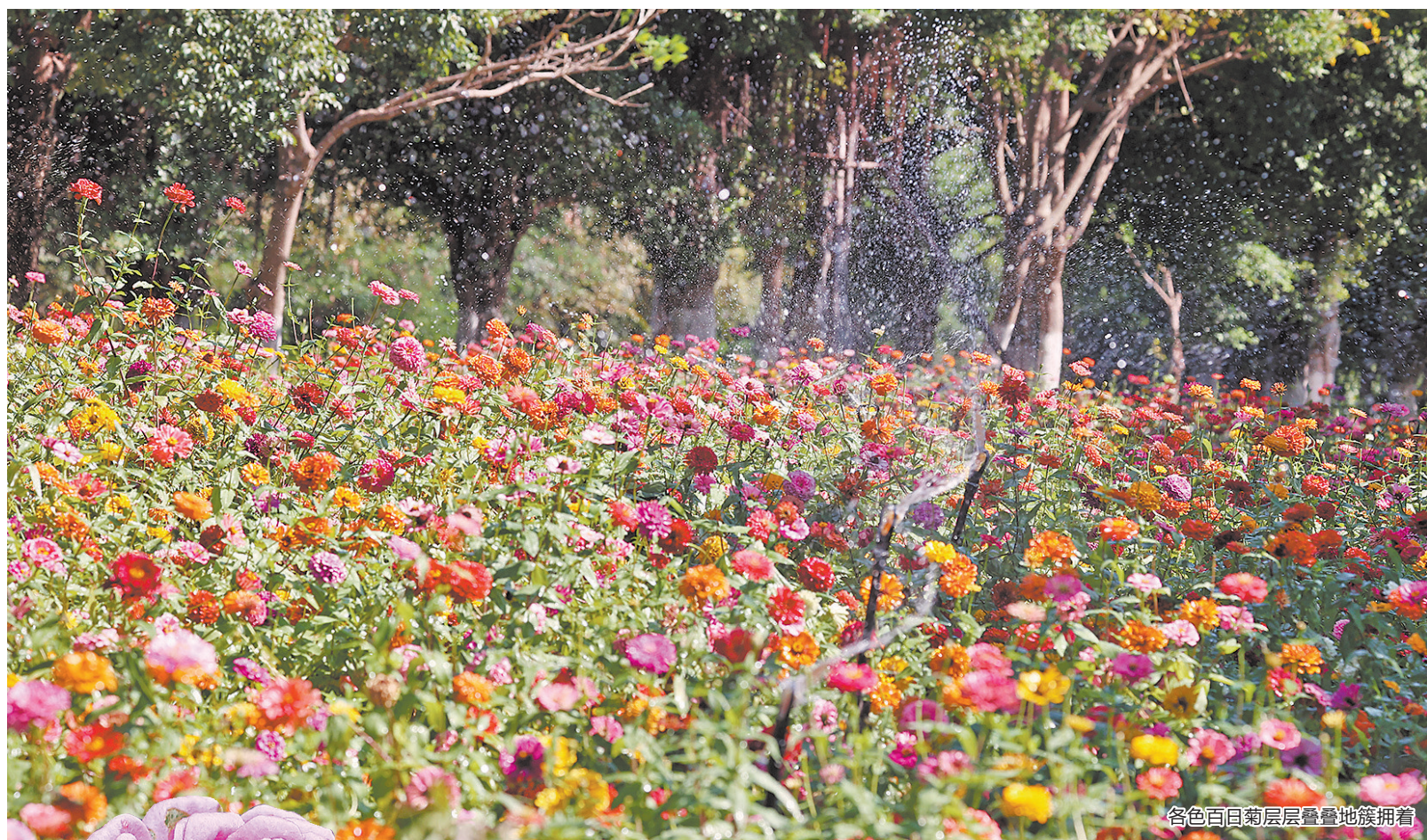
各色百日菊层层叠叠地簇拥着