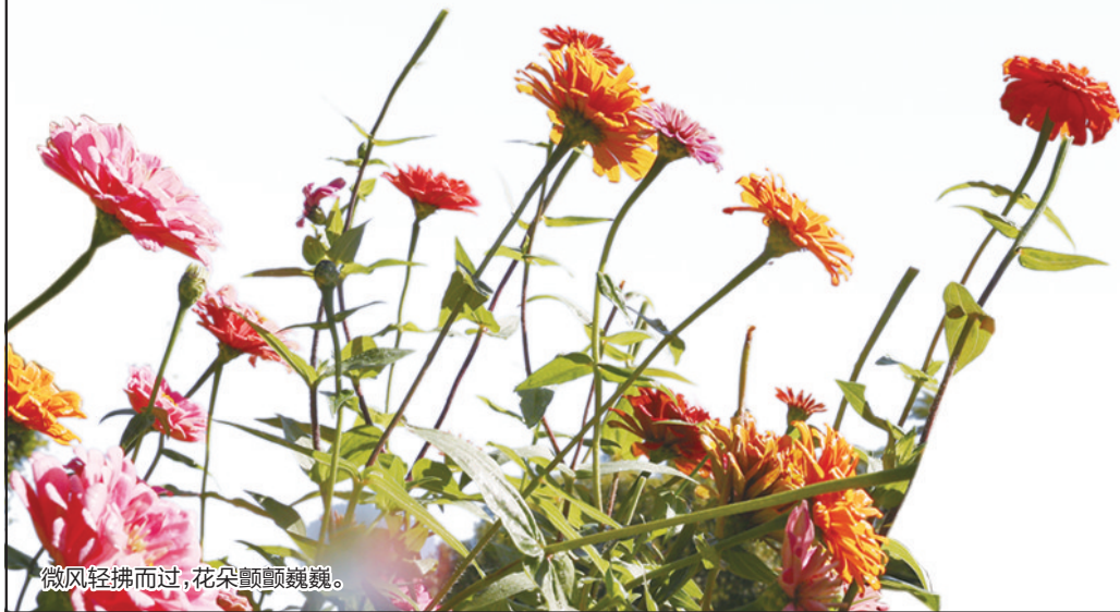
微风轻拂而过,花朵颤颤巍巍。