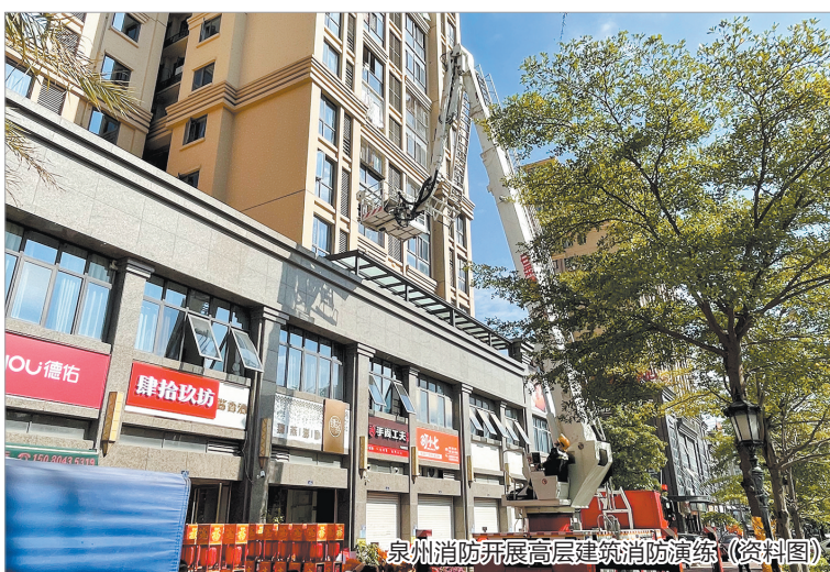
泉州消防开展高层建筑消防演练(资料图)