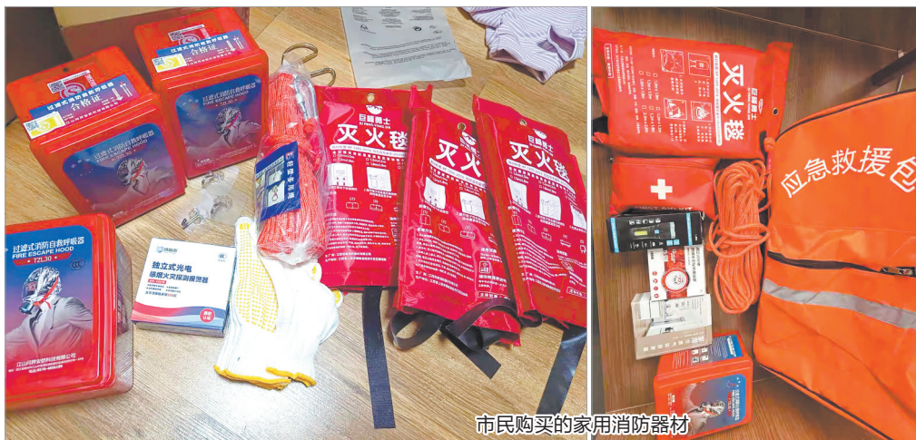
市民购买的家用消防器材