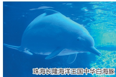
珠海长隆海洋王国中华白海豚