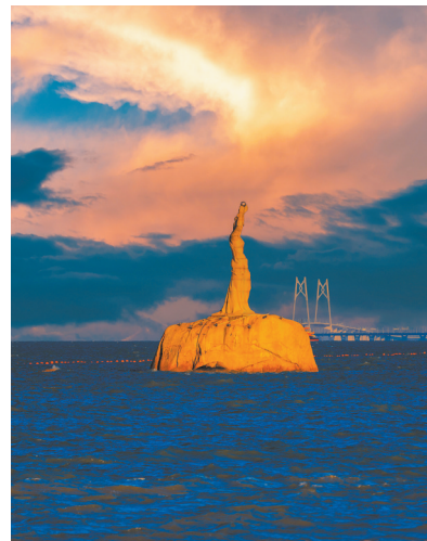
珠海香洲情侣路珠海渔女与港珠澳大桥中国结同框