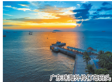
广东珠海外伶仃岛码头