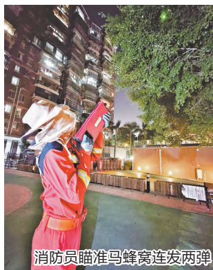
消防员瞄准马蜂窝连发两弹

据了解,清除马蜂窝是湖里消防一项重要的为民服务工作。今年1月至今,高崎消防救援站已累计出警清除马蜂窝(含黄蜂窝)217个,其中绝大多数借助这款灭蜂器完成作业,有效避免了传统火攻可能引发的树木、建筑起火风险。(台海网)