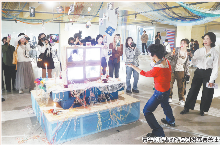
青年创作者的作品引发嘉宾关注

12月29日,由新世相联合上海钻石交易所发起的“能量的回声|创作者支持计划”在泉州台商区“浮石隐地”圆满落幕。该创作计划邀请到复旦大学教授梁永安、中国女演员倪虹洁、中国内地女歌手刘恋三位文化艺术领域代表担任联合发起人,8位来自音乐、文学、艺术等领域的青年创作者历经7天驻地创作,用多元作品完成了一场关于精神世界守护的文艺聚会。