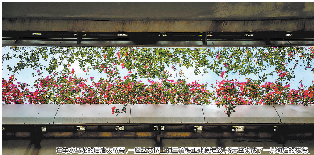
在车水马龙的后渚大桥旁,一座立交桥上的三角梅正肆意绽放,将天空染成了一片绚烂的花海。