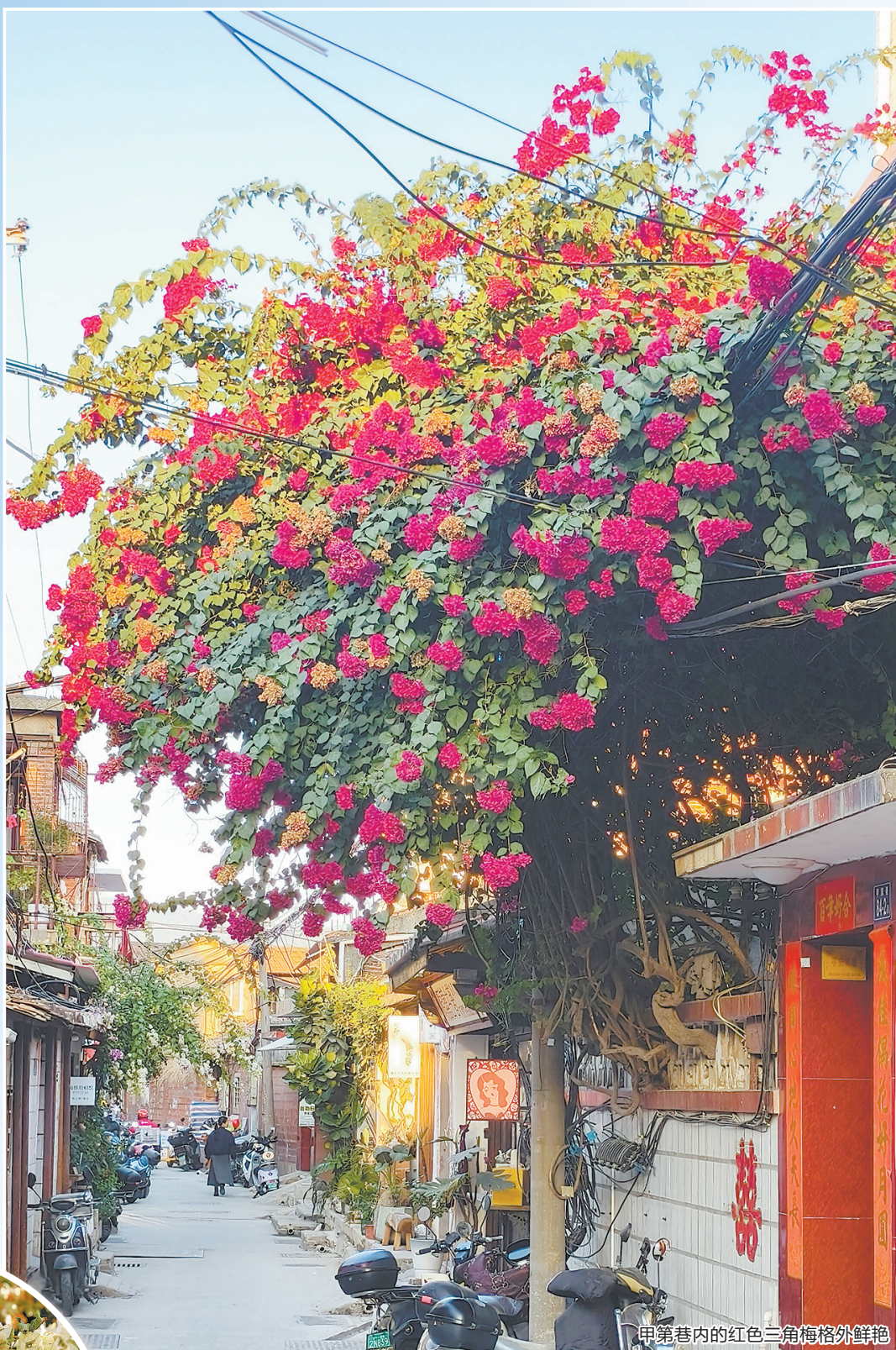
甲第巷内的红色三角梅格外鲜艳