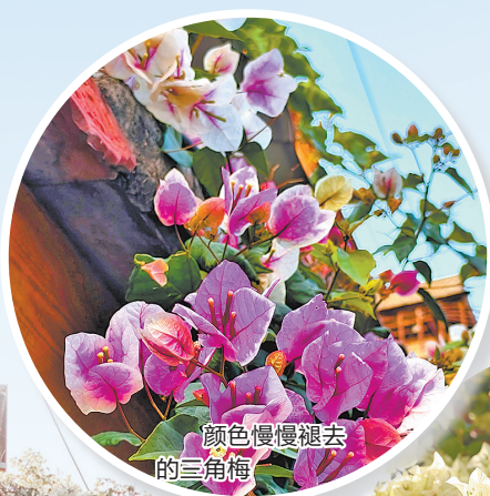
颜色慢慢褪去的三角梅