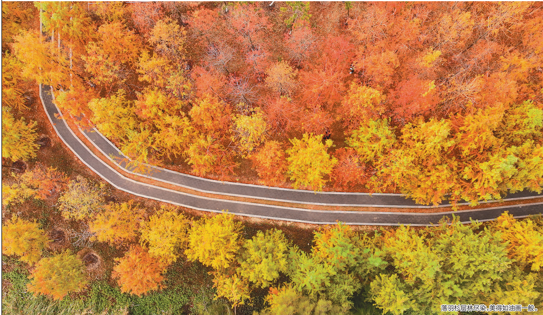
落羽杉层林尽染,美得如油画一般。