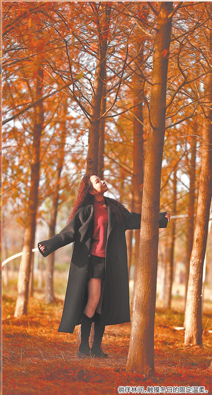
徜徉林间,触摸冬日的限定温柔。

目前,落羽杉已进入最佳观赏期,无需远行,城市之中便可邂逅自然之美。趁着晴好天气,不妨暂别喧嚣,走进“焦糖森林”,在色彩与光影的交织中,感受季节流转的温柔痕迹,收藏一份独属于泉州的冬日梦幻。