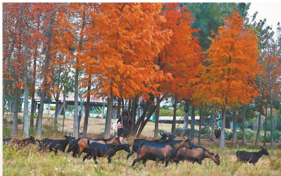
置身山野,感受大自然的“色彩魔法”。