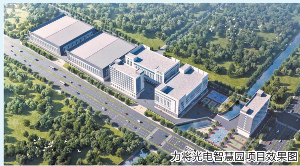
力将光电智慧园项目效果图