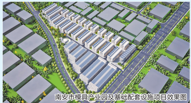
南安市模具产业园及基础配套设施项目效果图

温泉休闲娱乐区、田园生活体验区、芳塘度假康养区、森林世界探秘区和芳塘花园观赏区五大体验组团。总建筑面积约10万平方米,包括游客服务中心、温泉精品度假酒店、温泉康养度假中心、温泉水世界及户外汤池、生态停车