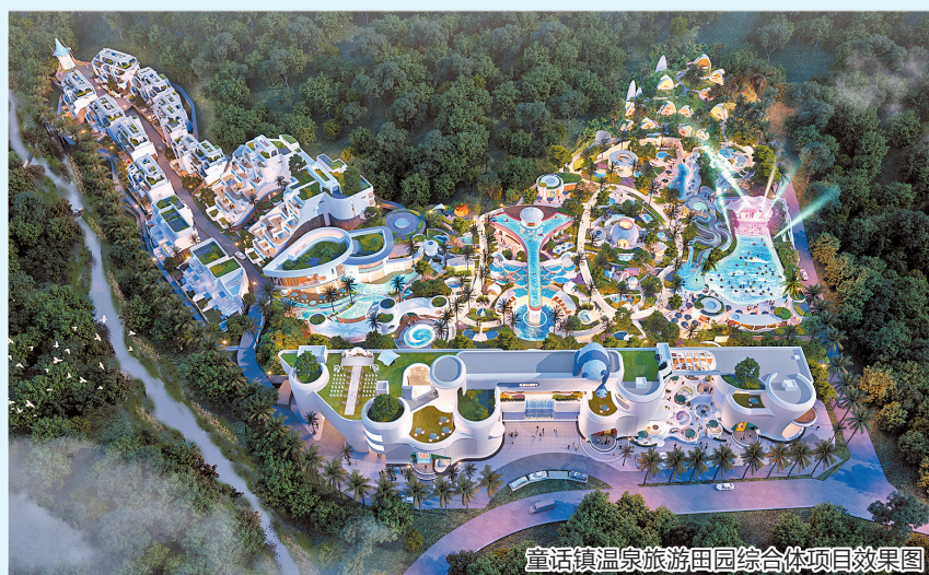
童话镇温泉旅游田园综合体项目效果图

童话镇温泉旅游田园综合体项目总投资额约10亿元。项目规划总占地面积2600亩,项目以本地特有“蹇”温泉资源为核心特色,并结合农林田园自然资源,打造以亲子家庭休闲度假体验为核心的温泉旅游田园综合体,共形成