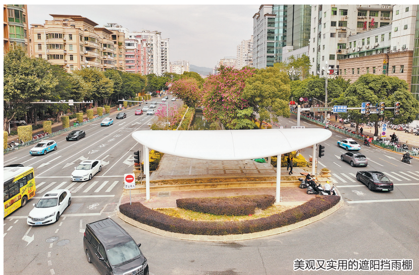
美观又实用的遮阳挡雨棚

市城管局高度重视,立即启动相关工作,专门组织人员赴福州市观摩考察,学习福州市道路交叉口渠化岛遮阳棚的建设经验和做法。经考察学习和向市政府专题汇报后,该局随即启动了市区遮阳棚试点建设,项目选址田安路