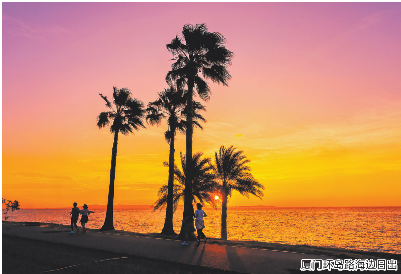
厦门环岛路海边日出

无论是向高峰挑战、在古道沉思,还是向阳光奔赴,每一次出发,都是旅行者与生俱来的开拓精神在召唤。旅行的意义,不在于所谓“方位玄机”,而在于将内心需求与自然意境、文化底蕴巧妙融合,通过沉浸式体验完成自我对话与状态更新。愿每位朋友都能在契合心意的旅程中,重拾“骏马踏清风,疾驰向新程”的昂扬与洒脱。