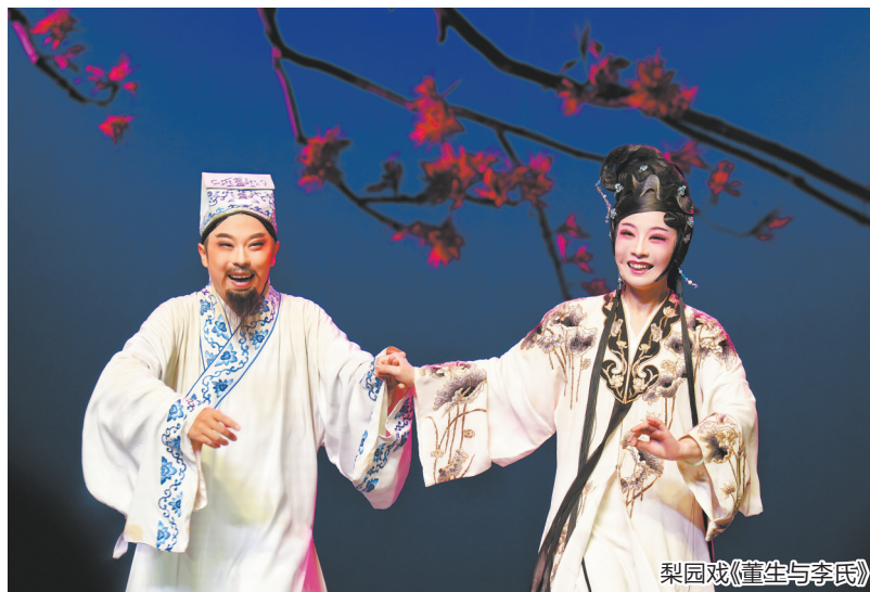
梨园戏《董生与李氏》

梨园戏《董生与李氏》自1993年首演以来,已累计演出超600场,足迹遍布全国并走向世界。在欧洲巡演期间,该剧凭借深厚的文化底蕴与精湛的艺术呈现,被国际专家盛赞为“达到喜马拉雅山脉高度的世界经典剧作之一”。这部由已故剧作家王仁