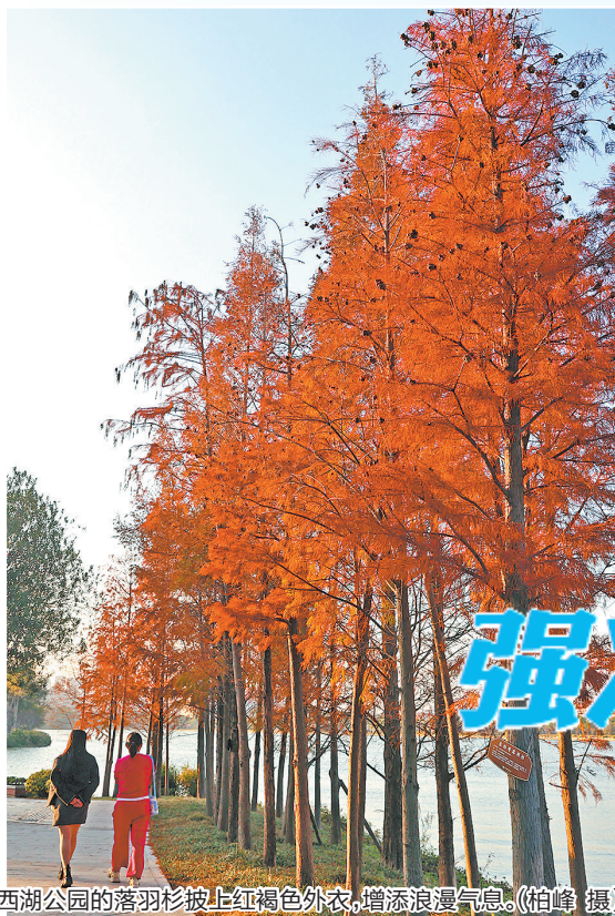
西湖公园的落羽杉披上红褐色外衣,增添浪漫气息。