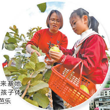
前来基地研学的孩子体验采摘芭乐

早报讯(融媒体记者林志安 通讯员林弘棖 文/图)冬日暖阳下,位于泉港区锦川村的一处生态采摘园内,游客们正享受着采摘的乐趣。这里曾是一片荒废闲置的农田,后被打造成绿色生态乐园,不仅为村集体增加了收入,还为近百位村民提供了就业机会。