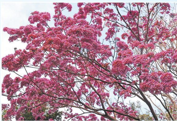
▼挂满枝头的粉紫色花朵,为冬日增添了一抹亮丽的色彩。