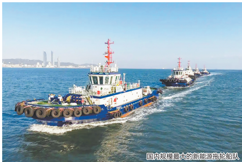
国内规模最大的新能源拖轮船队

据了解,传统拖轮依赖柴油动力,能耗高、排放量大。2023年10月,福建东南造船有限公司建造的国内首艘串联式混合动力拖轮“厦港拖30”交付投用。如今,四艘纯电拖轮——“厦港拖31”“厦港拖32”“厦港拖33”和“厦港拖34”交付投