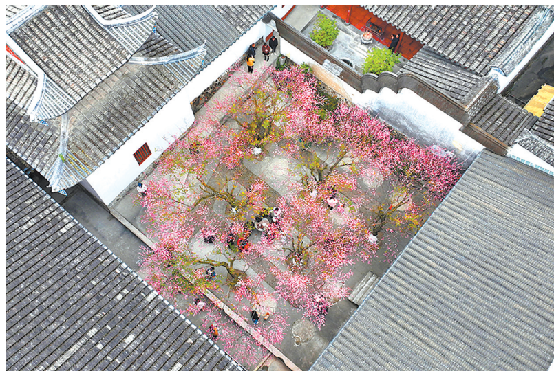
游客在花间赏花,若隐若现,宛若一幅流动画。

连日来,福州晋安区寿山乡千年古刹林阳寺内,600余株红梅、白梅、绿梅、宫粉梅、美人梅等次第绽放,正式迎来最佳观赏期,春节前后将达盛放高峰。