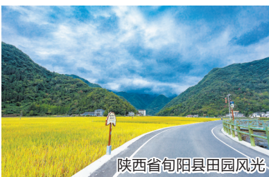
陕西省旬阳县田园风光