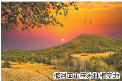
梅河口市玉米种植基地