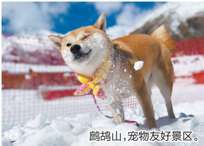
鹧鸪山,宠物友好景区。

两重天”的极致体验。当夕阳为雪峰镀上金边,入住一栋带有地暖与壁炉的藏式独栋木屋,星空仿佛触手可及。次日,只需驱车一个半小时,便能投入古尔沟温泉的怀抱,让雪山之寒在氤氲热气中消融。这份“高处滑雪、低处泡汤”的独特节奏,是川西冬季独一无二的馈赠。