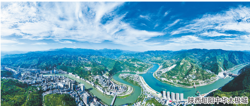
陕西旬阳中华太极城

从雪域驰骋到民俗狂欢,从创意混搭到田园牧歌,腊月的中国,总有一种旋律能触动你出发的渴望。这个冬天,不妨循着这曲“四重奏”,去发现一个超越你想象的、生动而立体的冬日中国。