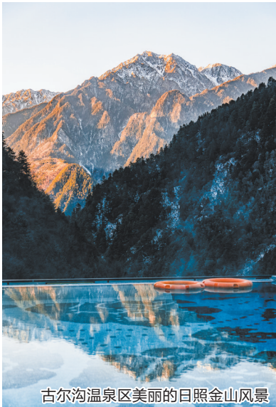
古尔沟温泉区美丽的日照金山风景