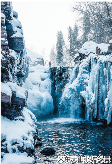
米东天山北坡冬景

体验制作非遗花馍、洞藏酿酒的乐趣;野趣追求者可前往哈熊沟欣赏壮丽雾凇,挑战雪地自驾;都市潮玩客则能在现代体育馆和商业综合体中,找到室内外结合的冰雪项目。这种“冰雪+非遗+田园+越野”的多元混搭,让米东区的冬天充满无限可能。