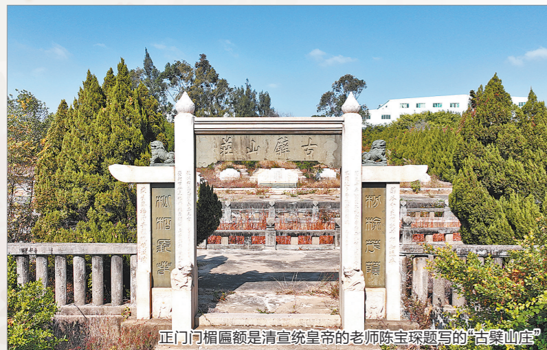
▲ 正门门楣匾额是清宣统皇帝的老师陈宝琛题写的“古槩山庄”