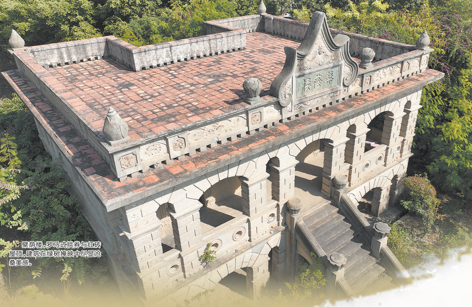
▲ 榭荫楼,罗马式拱券与红砖屋瓦,建筑在绿树掩映中尽显沧桑美感。