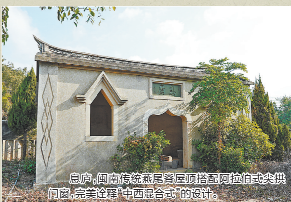
▲ 息庐,闽南传统燕尾脊屋顶搭配阿拉伯式尖拱门窗,完美诠释“中西混合式”的设计。