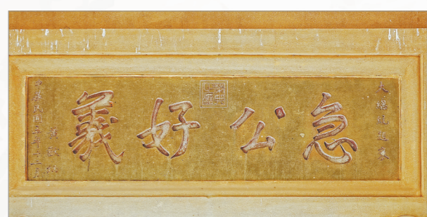
▲ 槩荫楼悬有“急公好义”匾额