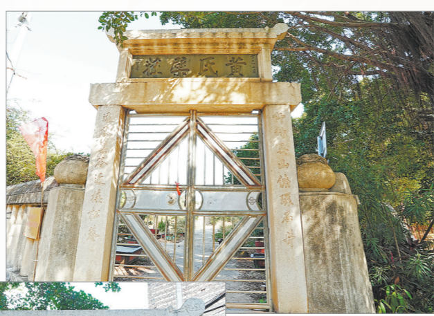
▲ 张謇题字、黄培松书写的“黄氏槩庄”山门

“晋江竟然有这么大的宝藏,(题咏者中)西泠印社的大家就好几个。”对于古槩山庄,群众读者更惊叹于其深厚的文化底蕴与华侨家族的家国情怀,盛赞这是一处集艺术价值与历史意义于一身的“宝藏”级文化遗产。为了更好地保护古槩山庄,山庄石碑刻文物修缮工作已于2021年完工。在此之前,槩谷村花了几年时间整合周边土地,依山建起槩庄公园,形成文物保护与休闲旅游结合的功能布局。2023年,槩谷村入选中国传统村落名录,古槩山庄功不可没。