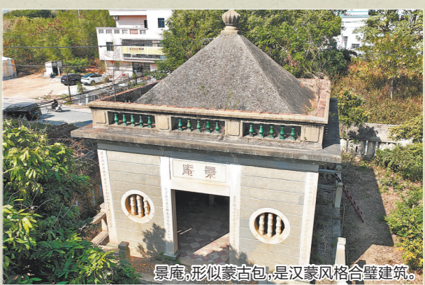
▲ 景庵,形似蒙古包,是汉蒙风格合璧建筑。