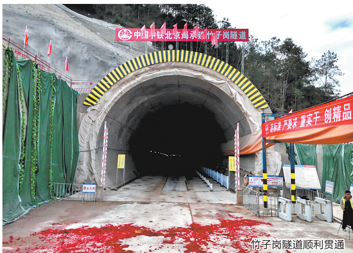
竹子岗隧道顺利贯通

龙龙高铁武梅段项目是福建省重点项目,正线全长102.4公里,线路串联起福建武平与广东蕉岭、梅县、梅江等地。项目建成后将实现龙龙高铁全线贯通,成为连接闽粤两省内陆的一条高速铁路通道,不仅能大幅缩短区域时空距离,更对完善区域铁路交