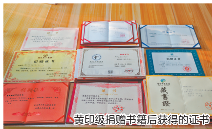
黄印级捐赠书籍后获得的证书