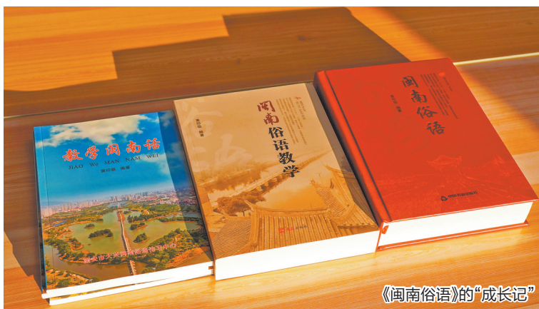
《闽南俗语》的“成长记”