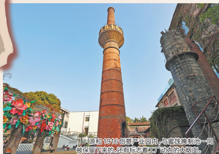
源和1916创意产业园内,与蜜饯腌制池一同被保留下来的,还有标志着工厂动力的大烟筒。

从“蜜饯”到“创意”,烟筒守护的不仅是一段品牌记忆,更是一种从传统中创新求变的精神传承。