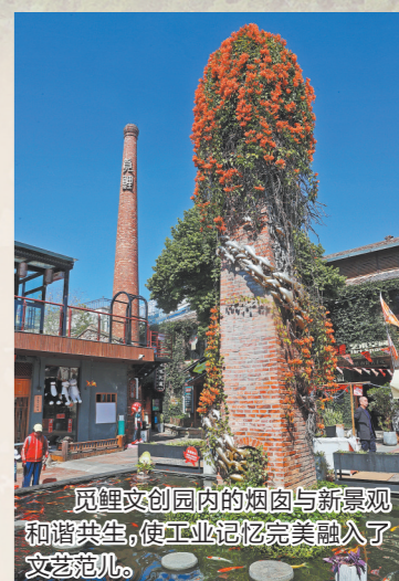
鲤鲤文创园内的烟筒与新景观和谐共生,使工业记忆完美融入了文艺范儿。