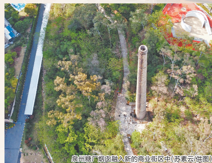
泉州糖厂烟筒融入新的商业街区中