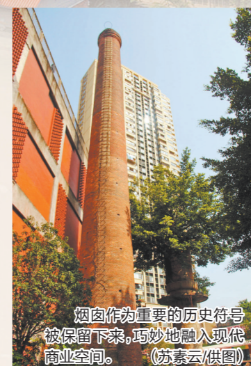
烟筒作为重要的历史符号被保留下来,巧妙地融入现代商业空间。