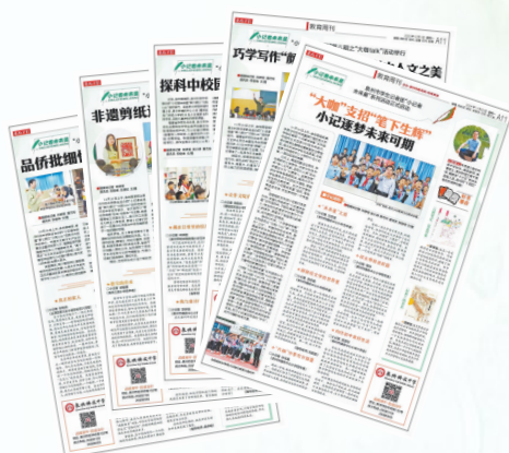
▲“小记者未来星”往期活动报道版面