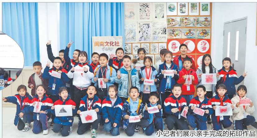
小记者们展示亲手完成的拓印作品