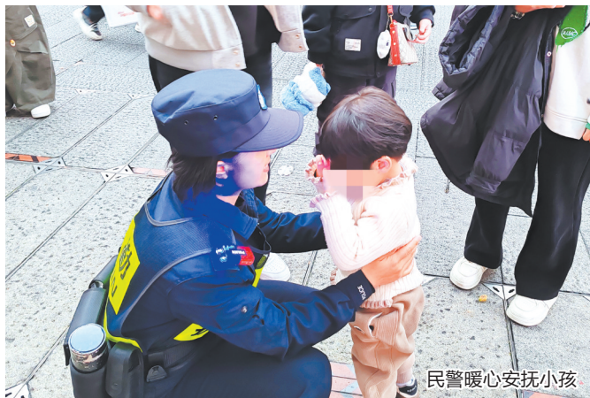
民警暖心安抚小孩

早报讯 (融媒体记者许奕梅 通讯员郑火全 文/图) 春节假期,泉州古城火出圈。当众多游客市民沉浸在节日的欢愉中时,总有那一抹抹“藏青蓝”在暖心守护。