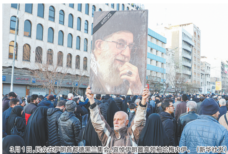
3月1日,民众在伊朗首都德黑兰集会,哀悼伊朗最高领袖哈梅内伊。

据报道,伊朗最高领袖由专家会议选举产生。宪法规定专家会议为常设机构,由公民投票选举88名法学家和宗教学者组成,其职责是选定和