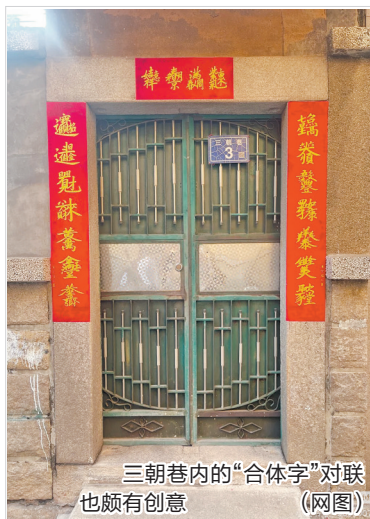
三朝巷内的“合体字”对联也颇有创意(网图)