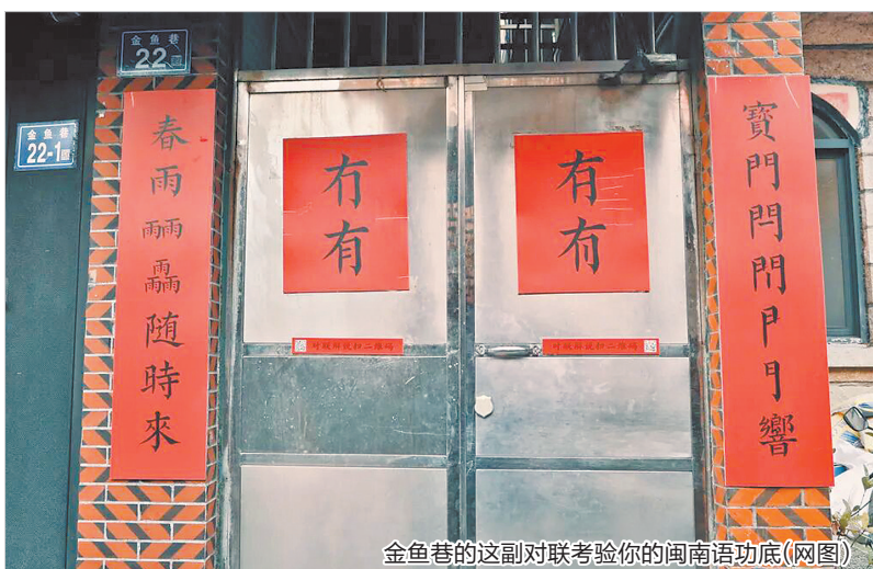
金鱼巷的这副对联考验你的闽南语功底