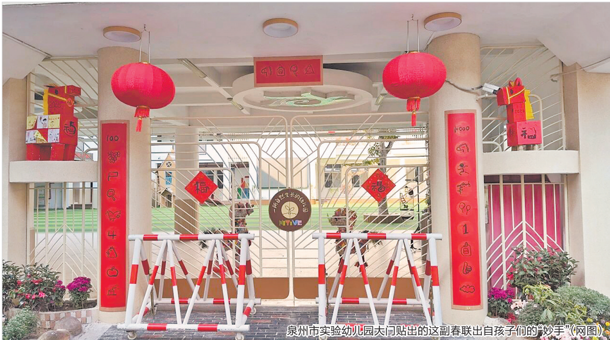
泉州市实验幼儿园大门贴出的这副春联出自孩子们的“妙手”(网图)