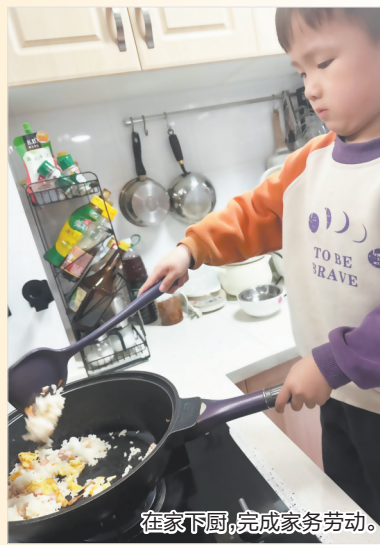
在家下厨,完成家务劳动。