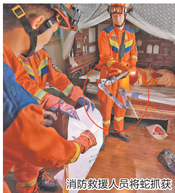
消防救援人员将蛇抓获

抵达现场后,消防救援人员穿戴好防护装备,带上捕蛇器进入卧室搜寻,很快便在卧室墙角发现了蛇。经救援人员辨认,这