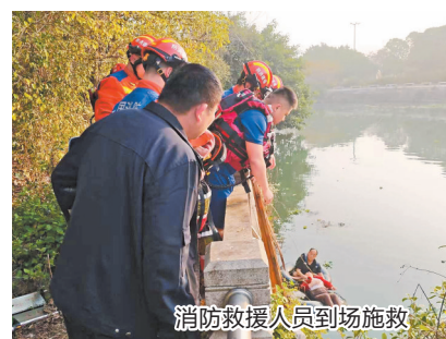
消防救援人员到场施救

惠安县建设路消防救援站接到报警后,迅速出动2车12名消防救援人员赶赴现场处置。救援人员抵达现场后,发现两名被困人员在河中挣扎,体力逐渐不支。指挥员立