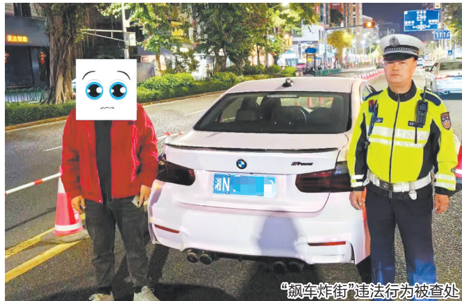
“飙车炸街”违法行为被查处