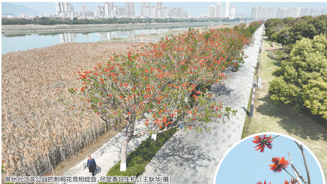
泉州北江滨公园的刺桐花竞相绽放,尽显春日生机。

眼下正值春季农业生产关键期,建议农户及种植基地密切关注天气变化,注意田间排湿防渍,抓住有利时段开展农事,加强病害监测与防治,做好大棚温湿度调控。