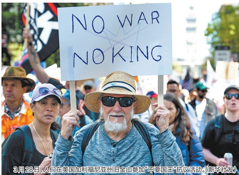
3月28日,人们在美国加利福尼亚州旧金山参加“不要国王”抗议活动。

新华社电 美国多地28日爆发示威抗议活动。数百万民众走上街头,针对特朗普政府的移民执法等一系列政策表达不满,呼吁结束对伊朗的军事打击。