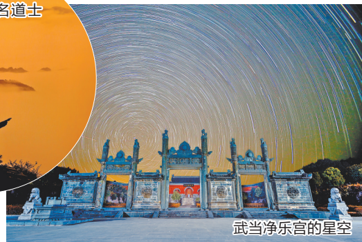
武当净乐宫的星空