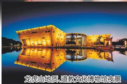
龙虎山地质、道教文化博物馆夜景