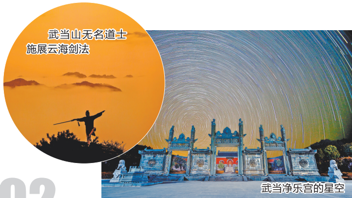
武当山无名道士 施展云海剑法