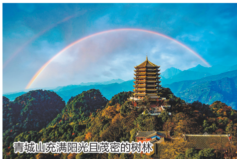
青城山充满阳光且茂密的树林

交通:成都地铁2号线至犀浦站,换乘城际列车至青城山站 门票:前山90元,后山20元 体验:青城武术晨练、道茶采制